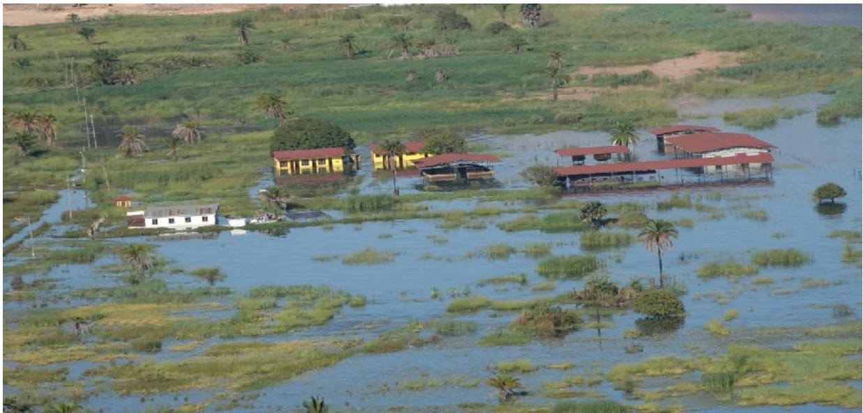
Miundombinu ya Mwalo wa Kasanga uliopo Wilaya ya Kalambo ikiwa imezingirwa na maji kutokana na mafuriko yaliyotokana na mvua kubwa iliyonyesha katika msimu wa mwaka 2020 Miundombinu ya Mwalo wa Kasanga uliopo Wilaya ya Kalambo ikiwa imezingirwa na maji kutokana na mafuriko yaliyotokana na mvua kubwa iliyonyesha katika msimu wa mwaka 2020