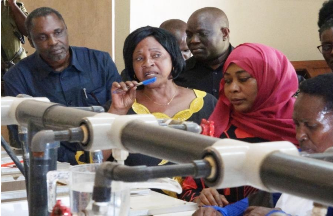
Waziri wa Mifugo na Uvuvi Mhe. Mashimba Ndaki (wa kwanza kushoto), akifuatiwa na Mwenyekiti wa Kamati ya Kudumu ya Bunge ya Kilimo, Mifugo na Maji Mhe. Dkt. Christine Ishengoma wakipatiwa maelezo juu ya uzalishaji wa vifaranga vya samaki wakati kamati hiyo ilipotembelea kituo cha ukuzaji viumbe maji Kingolwira, Morogoro