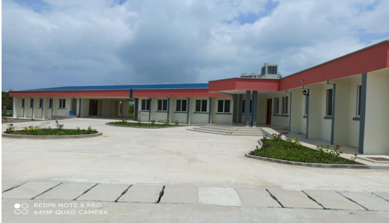
Jengo la Maabara Mpya ya TAFIRI, Kunduchi, Dar es Salaam. Maabara hii itawezesha utafiti wa uvuvi na ukuzaji viumbe maji.