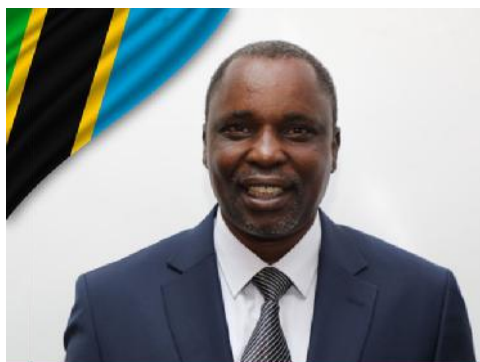
Mashimba Mashauri Ndaki Waziri wa Mifugo na Uvuvi