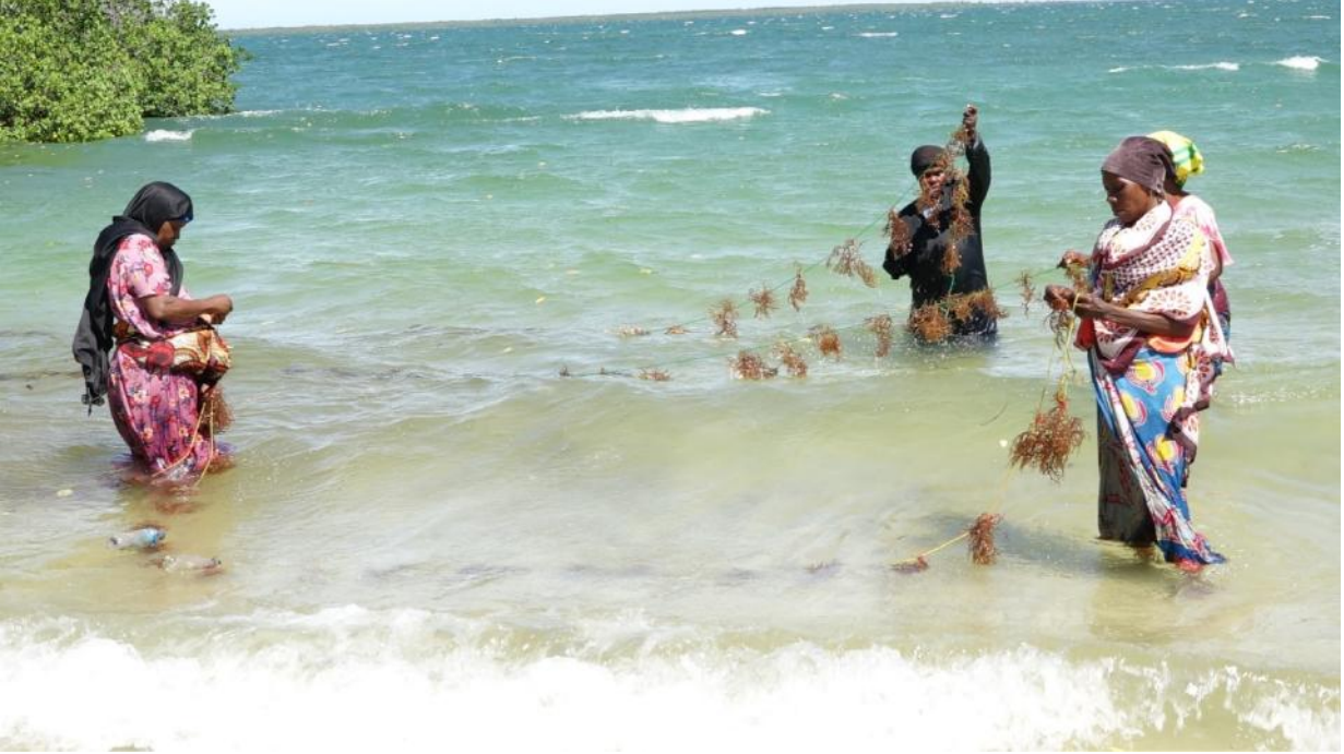
Baadhi ya wakulima wa mwani wakiwa kwenye shamba la mwani katika Kijiji cha Tawalani, kilichopo Wilaya ya Mkinga, Mkoani Tanga