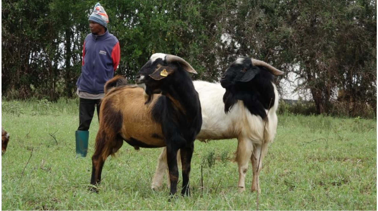
Mbegu bora za mbuzi walioo katika Taasisi ya Utafiti wa Mifugo Kituo Tanzania cha West Kilimanjaro