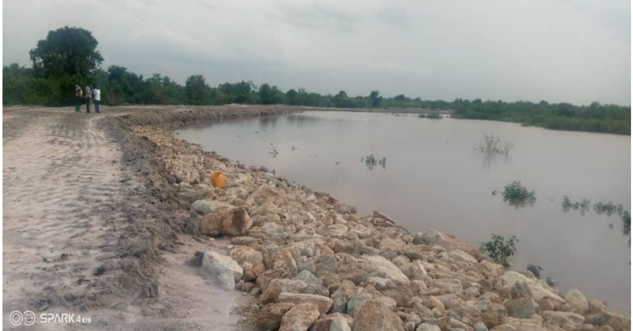
Bwawa la maji kwa ajili ya mifugo la Kimokouwa katika Halmashauri ya Wilaya ya Longido